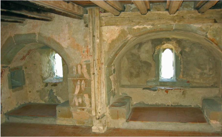
Burg Hohenklingen über Stein am Rhein (SH), Wohnturm, Fensternischen mit steinernen Sitzbänken