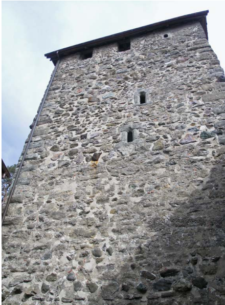
Burg Hohenklingen über Stein am Rhein (SH), Wohnturm mit Eckbuckelquadern