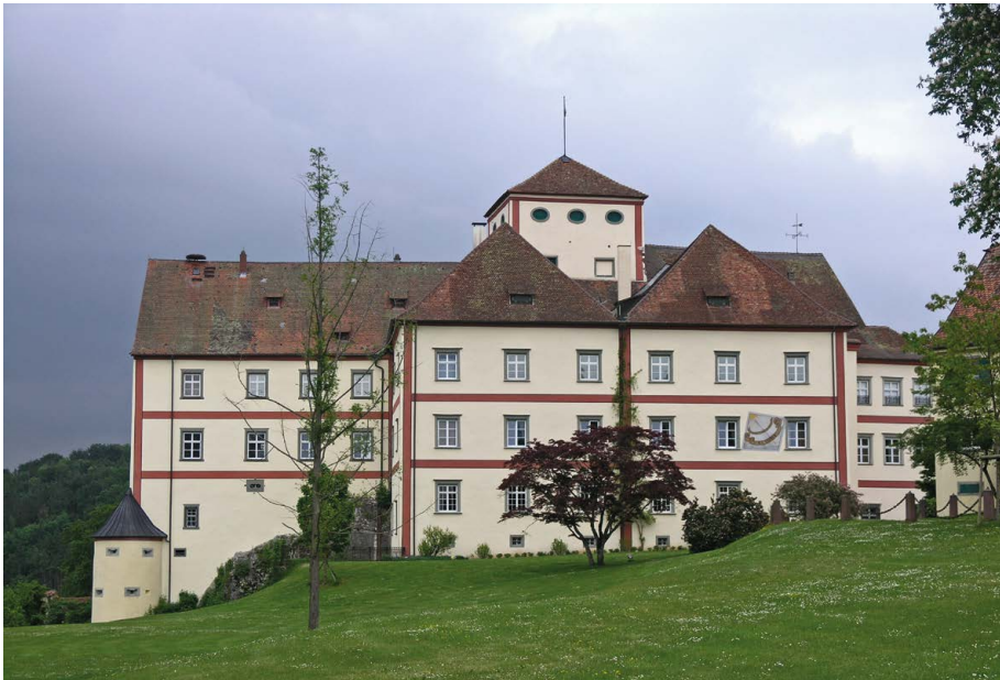
Schloss Langenstein (Orsingen-Nenzingen), Wacken-Wohnturm, umgeben von Bauten der Renaissance