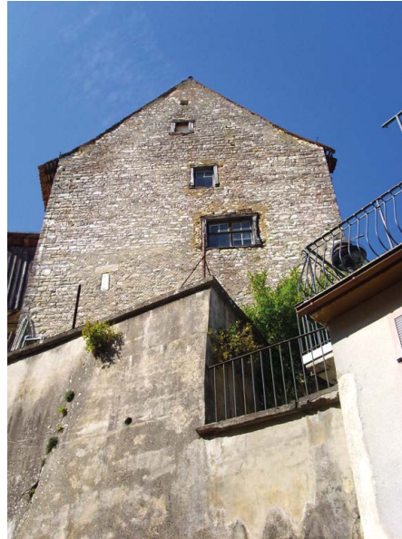
Der sog. Spiecher in Honstetten (Eigeltingen), Wohnturm der romanischen Burg, 12. Jh.