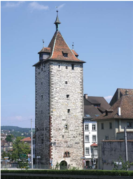
Schaffhausen (SH), Obertorturm, 1273 erwähnt und von den Herren von Fribolten als Wohnturm genutzt. 1461 an die Stadt verkauft, 1491 erhöht und zur Verteidigung mit Feuerwaffen ausgebaut

sich schnell korrigieren, wenn man weiß, dass Schießscharten in Deutschland bis Ende des 13. Jahrhunderts noch nicht verbreitet und sogar in spätromanischen Burgen noch absolute Ausnahmen waren.