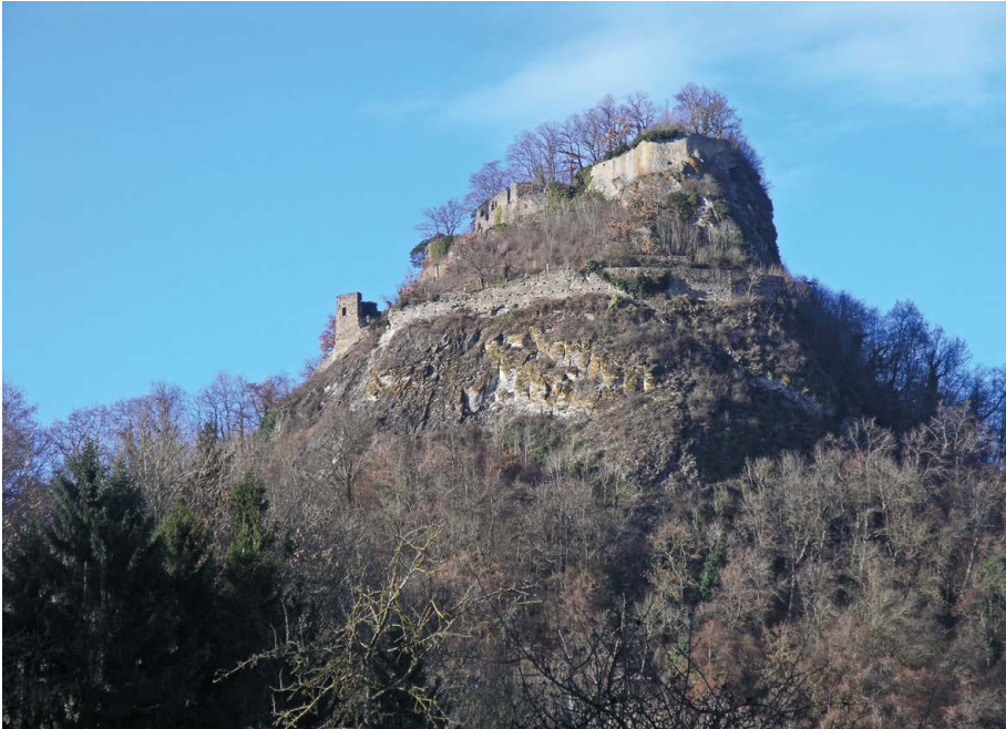
Burg Hohenkrähen (Duchtlingen), eine wahrscheinlich im letzten Drittel des 12. Jh. von den Herren von Friedingen erbaute Gipfelburg

hohen Moränenhügel nutzt, und vermutlich das Seehofschlösschen in Steißlingen aus Motten hervor.