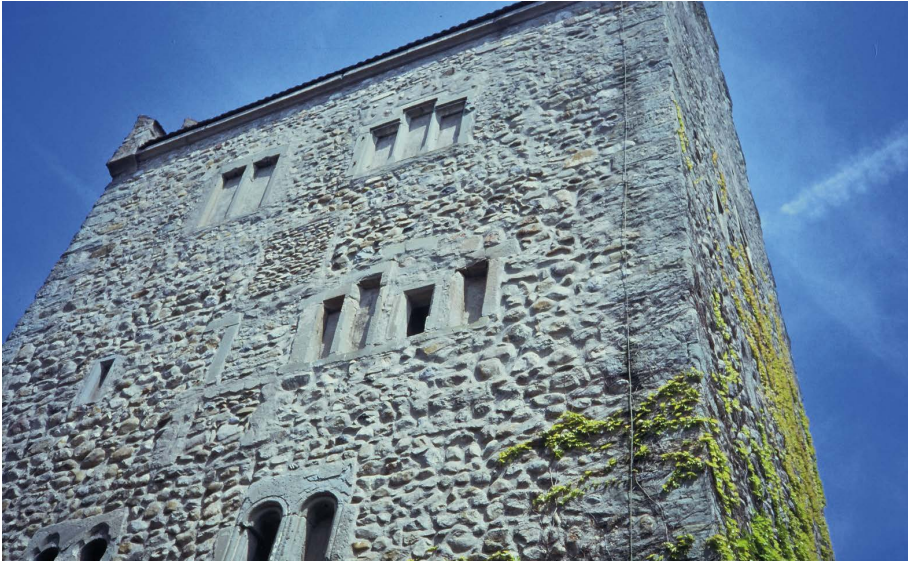
Burg Oberstaad (Öhningen), Wohnturm der romanischen Uferrandburg, im Kern wohl 12. Jh., mehrfach im Spätmittelalter und der Frühen Neuzeit verändert