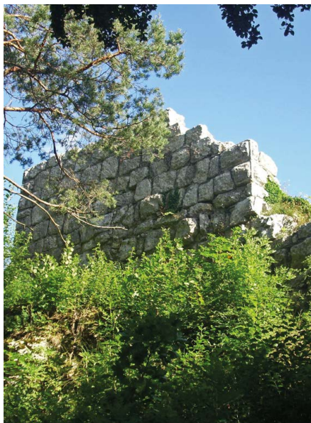
Burgruine Radegg (Osterfingen, SH), Teilansicht der Hauptburg mit Buckelquadern