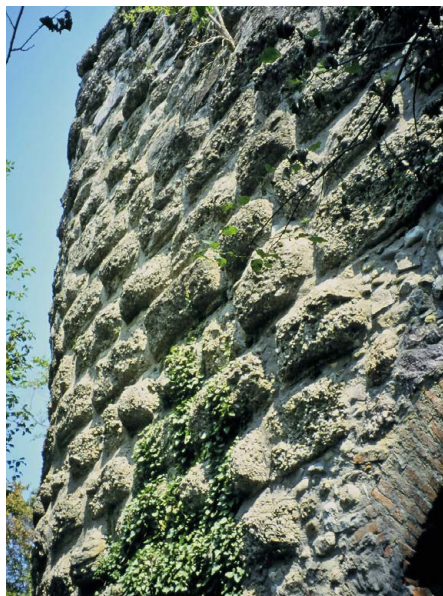
Homburg über Stahringen, Schildmauer mit Buckelquaderverkleidung an der Feldseite