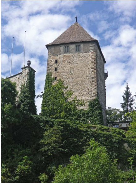
Schloss Herblingen (Stetten, SH), Wohnturm, wohl 13. Jh.