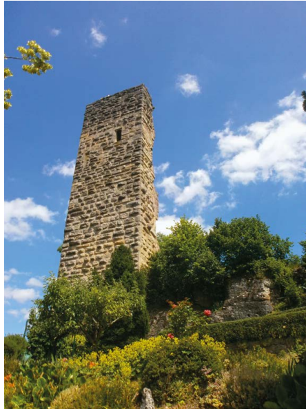
Burg in Tengen, Buckelquaderbergfried