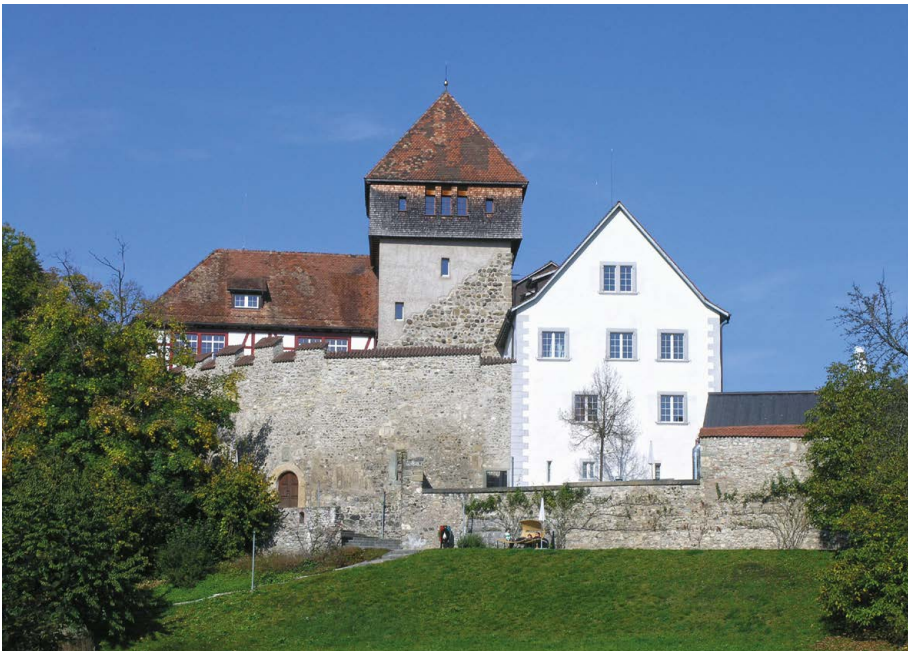
Burg Unterhof in Diessenhofen (TG), Spornburg, Wohnturm erbaut um 1185, die Burg erweitert 1276-78