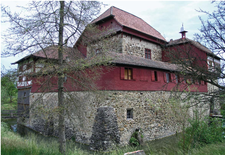
Burg Hagenwil (Amriswil, TG), Niederungsburg als Wasserburg in einem Hanggelände, der Hauptturm 1. Hälfte 13. Jh.