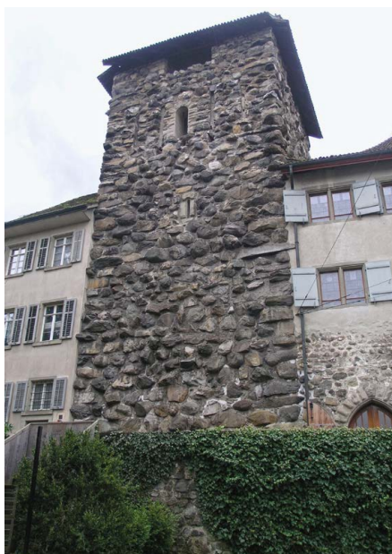
Burg in Frauenfeld (TG), Wackenturm, um 1235/45