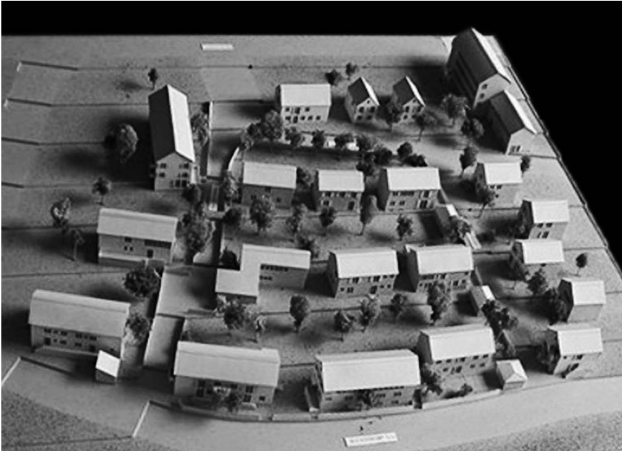
Traditionelles Bauen der »Stuttgarter Schule«: Modell der Kochenhof-Siedlung in Stuttgart – mit Satteldach

Die »Stuttgarter Schule« ist der Gegenentwurf zum Bauhaus, das mit klaren Formen und der deutlich erkennbaren Funktion der einzelnen Räume und Hausteile auf der ganzen Welt Maßstäbe gesetzt hat. Beide Richtungen sind mit Stadtquartieren in der durch Bombenkrieg und den darauf folgenden »autogerechten« Wiederaufbau geschundenen Stadt Stuttgart vorhanden.