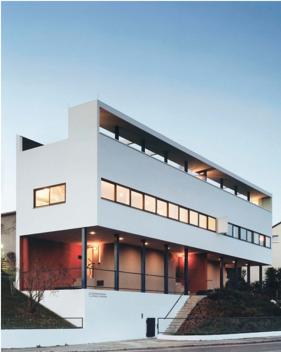
Modernes Bauen: Das Le Corbusier-Haus in der Stuttgarter Weissenhofsiedlung – mit Flachdach