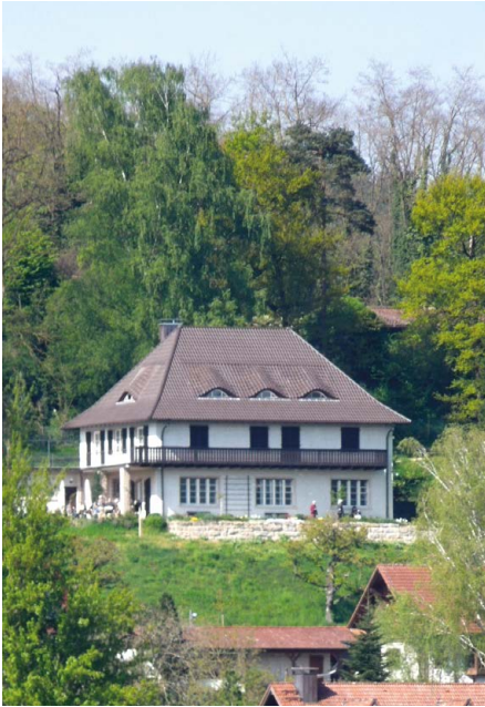
Das Dix-Haus in Hemmenhofen: »a much more völkisch House« Schelchers