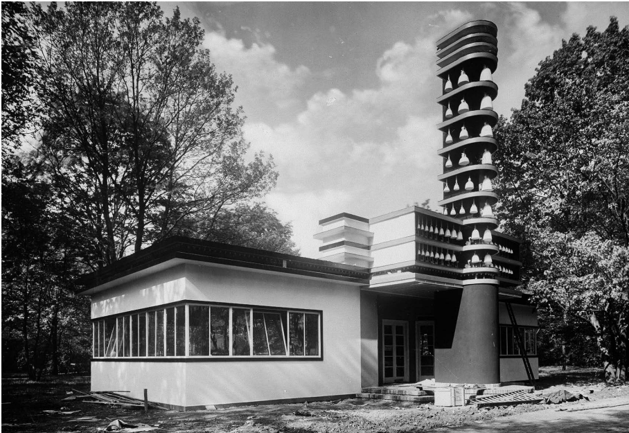
Das Gebäude mit Glockenspielturm, entworfen von Arno Schelcher und Fritz Meister, Dresden 1930

seinem Haus: »massiv hergestellt und [...] im Sockel in den Architekturteilen mit Klinkern verblendet und im Uebrigen von farbigem Edelputz versehen«. Ansonsten sollte der Ausbau des Hauses im Innern »in einfacher, aber gediegener Art ausgeführt werden«.