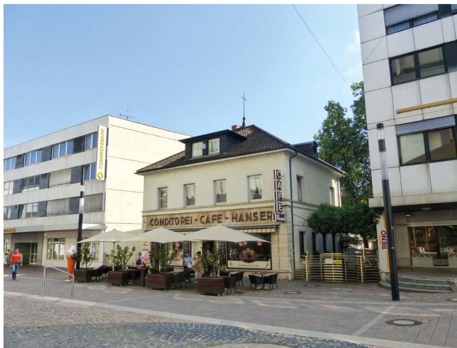
Das Café Hanser in der August-Ruf-Straße 4 in Singen

Planungsabsichten der jungen Stadt. Für den Innenstadtbereich sah die Verwaltung die Ansiedlung von Geschäftshäusern und für den Bereich südlich der Bahn gewerbliche Anlagen vor. 7 Der neue Gesamt-Bebauungsplan aus dem Jahr 1923 sah weiterhin den Ausbau der Kaiserstraße, die seit 1922 Walther-Rathenau-Straße hieß, als reine Geschäftsstraße und nicht als Verkehrsstraße vor.