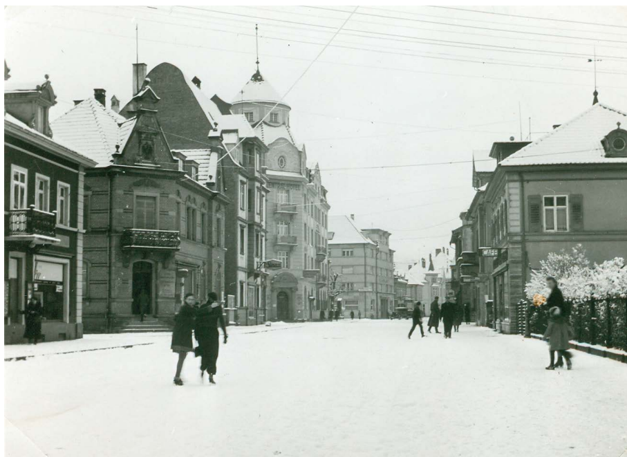
Blick in die Kaiserstraße mit dem Café Hanser auf der rechten Seite, 1930er Jahre

durch das Verlegen eines neuen Bodens und die Beschaffung von Efeu-Gartenmöbeln auch bereits Tatsachen geschaffen.