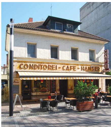
Das Café Hanser in Singen und sein Eingangsbereich im Art-Déco-Stil

hatte dieses Gebäude zu Beginn der 1930er Jahre im Zuge einer Zwangsversteigerung vom bisherigen Besitzer Burkhardt erworben. Nach Übertragung der neuen Konzession wollte Hanser den Betrieb dieses Cafés einstellen und den Umbau der dann leerstehenden Räumlichkeiten zu Wohnungen auf eigene Kosten übernehmen.