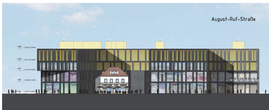
Projektierte Fassadenansicht des »Cano« in Singen, von der August-Ruf-Straße aus gesehen