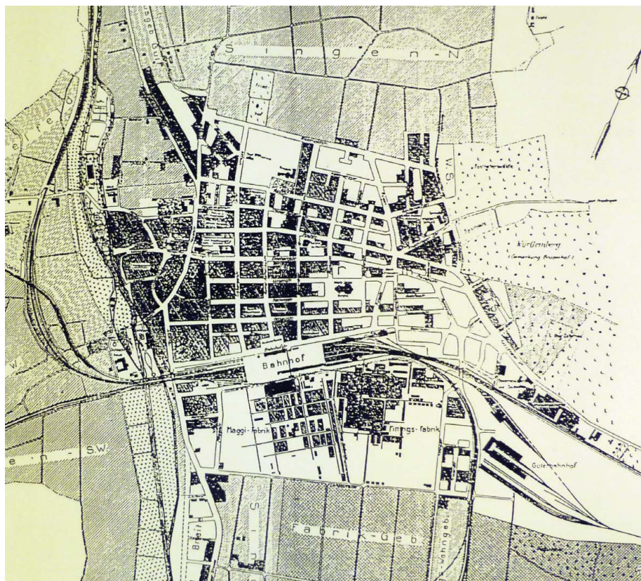
Originalplan Bebauungsstand Kernstadt Singen von 1923, Ausschnitt

Treppe im Vorgarten gebaut, wofür Waldschütz eine baurechtliche Genehmigung von Seiten der Stadt erhalten hatte. 15 Nach dem Einfriedungsplan waren der Eingangsbereich mit Zypressen und der Gehweg bis zur Treppe mit einer Mauer eingefasst. Für die Gestaltung von Vorgärten und Vorplätzen legte die Bauordnung für die Stadtgemeinde Singen-Hohentwiel vom 15. September 1911 in der geänderten Fassung vom 26. Juni 1914 in § 29 genaue Vorgaben fest: »Sind in dem Ortsstrassenplan Vorgärten vor den Gebäuden festgesetzt, so ist der Geländestreifen zwischen der Gebäudefluchtlinie und der Strasse in seiner ganzen Ausdehnung in angemessener Weise als Ziergarten anzulegen und zu unterhalten. [...] In Vorgärten und Vorplätzen dürfen [...] Freitreppen [...] bis an die Strassenflucht vorgebaut werden.« 16