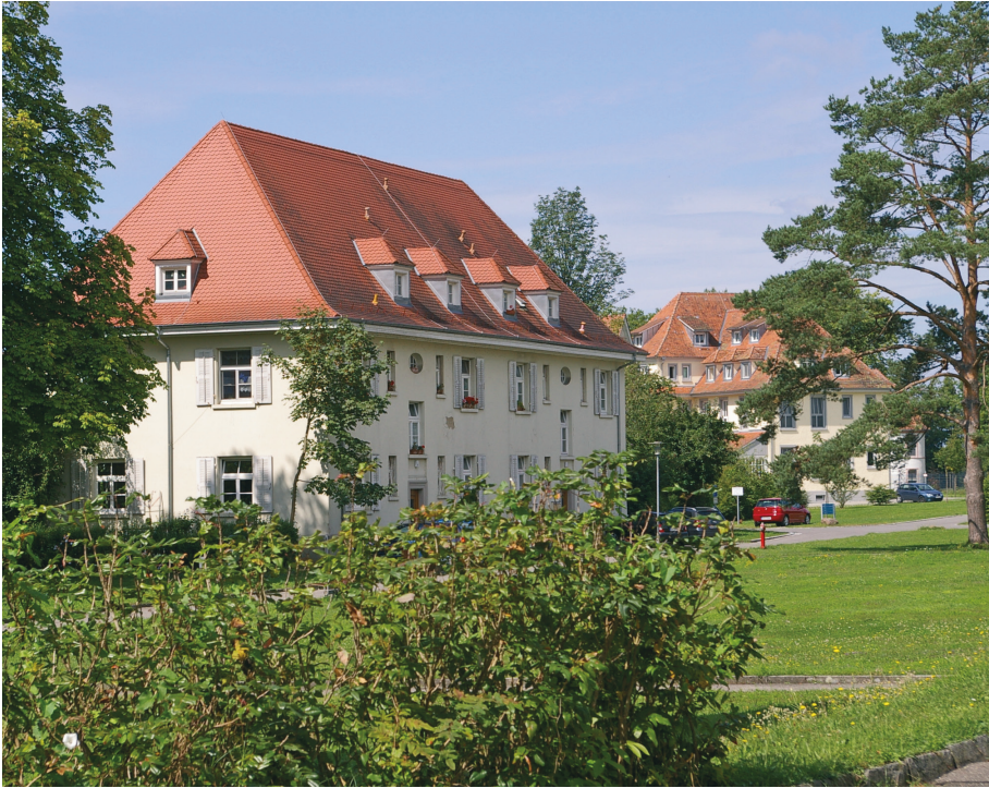
Das Zentrum für Psychiatrie Reichenau heute; die einstige »Großherzogliche Badische Heil- und Pflegeanstalt bei Konstanz« wurde 1913 eröffnet, das Bauensemble ist in großen Teilen bis heute erhalten geblieben.

der, die Tochter lebe in Paris, der Sohn in Zürich. Die Ehe sei vor zwei Jahren geschieden worden. Aus dem Krieg sei er völlig verändert zurückgekommen, es habe ihn nichts mehr interessiert, er sei schwermütig gewesen.