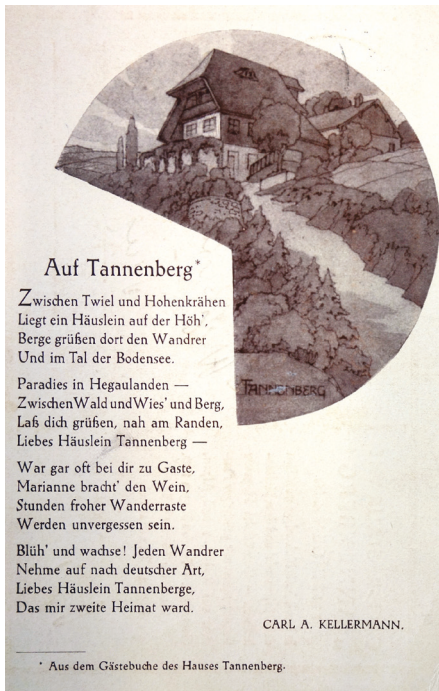
Postkarte mit dem Café Tannenber und dem Kellermann-Gedicht »Auf Tannenber«